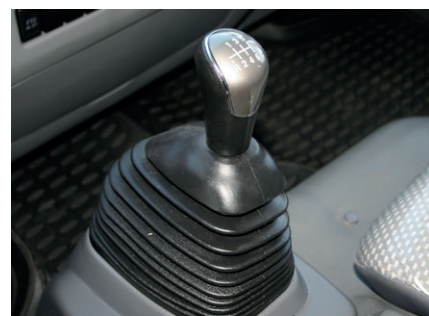
Рычаг механической КПП установлен на небольшом подиуме