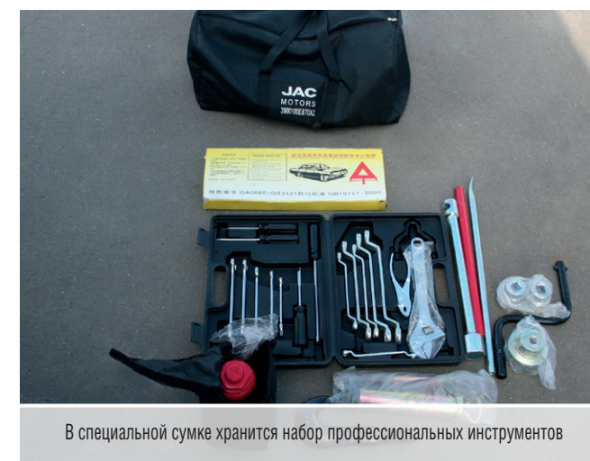
В специальной сумке хранится набор профессиональных инструментов

дартным фургоном он равен 2535 мм. С учетом угла съезда 18° нужно быть очень осторожным на неровной дороге. А едь тестовый вариант с надстройкой «Автомеханического завода» имеет увеличенный еще на 500 мм задний свес, и забывать об этом никак нельзя.