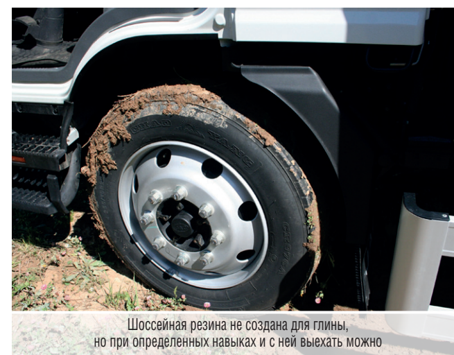
Шоссейная резина не создана для глины, но при определенных навыках и с ней выехать можно