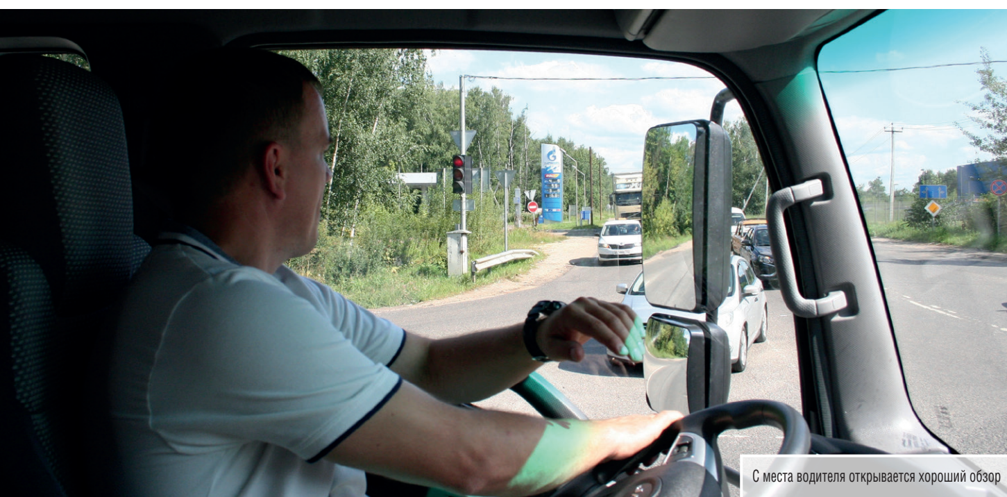
С места водителя открывается хороший обзор

В целом JAC N120 производит очень хорошее впечатление. Если не покуситься и приобрести дополнительное оборудование, он станет еще более желанным приобретением. Для этого на заказ предлагаются: центральный замок, электрические стеклоподъемники, кондиционер, упомянутый подогреватель Webasto и др. В полной комплектации шасси JAC N120 стоит 2,35 млн руб. без учета дополнительных скидок, что вполне конкурентоспособно.