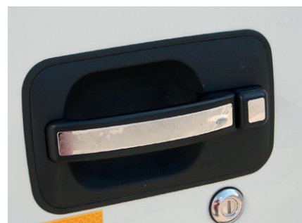
Дверные ручки стали удобнее