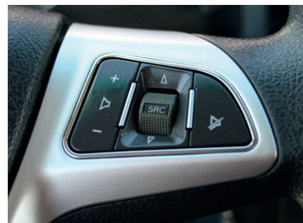
На рулевом колесе появились клавиши управления «музыкой» и круиз-контролем

Некоторой компенсацией за такие неудобства служат гидроусилитель руля и хорошая геометрическая проходимость. В частности, на резине размерностью 255/70 R22,5 минимальный дорожный просвет получился никак не меньше 218 мм, а преодолеваемый подъем отмечен значением 30%. У автомобиля небольшой передний свес в 1180 мм и угол въезда 24°, что позволяет не только переезжать «лежащих полицейских», но и при необходимости смело съезжать с асфальта на грунтовку и возвращаться обратно. Правда, задний свес великоват: даже со стан-