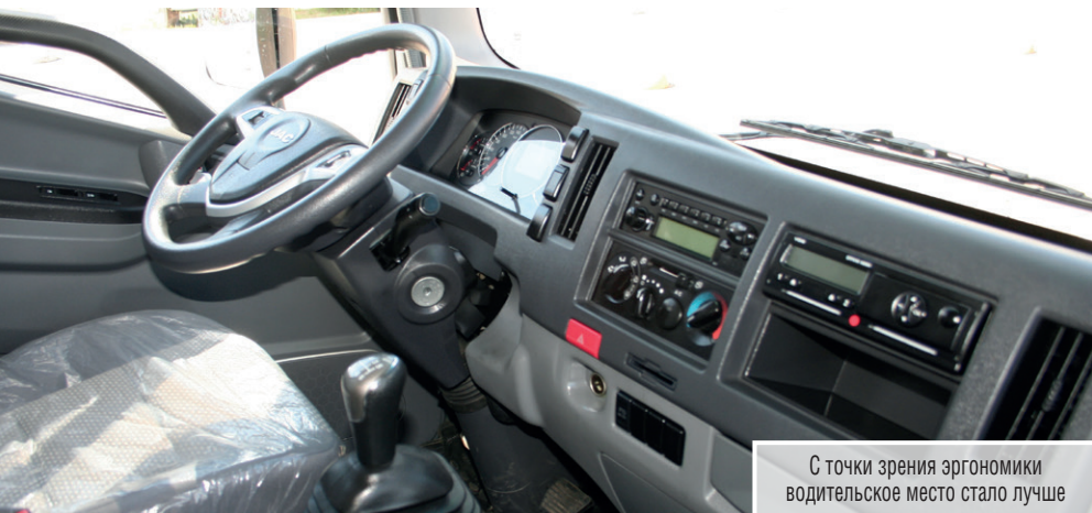
С точки зрения эргономики водительское место стало лучше