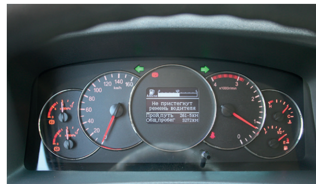
Бортовой компьютер русифицирован и не требует много времени на привыкание

Сегодня JAC пришел в Россию основательно и уже не доверяет посредникам-перекупщикам. Для транспортных компаний это означает, что они не останутся один на один с вопросами снабжения запасными частями, текущим ремонтом и сервисным обслуживанием.