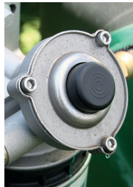
Прокатка топливной системы теперь выполняется не с помощью стартера, а с помощью кнопки