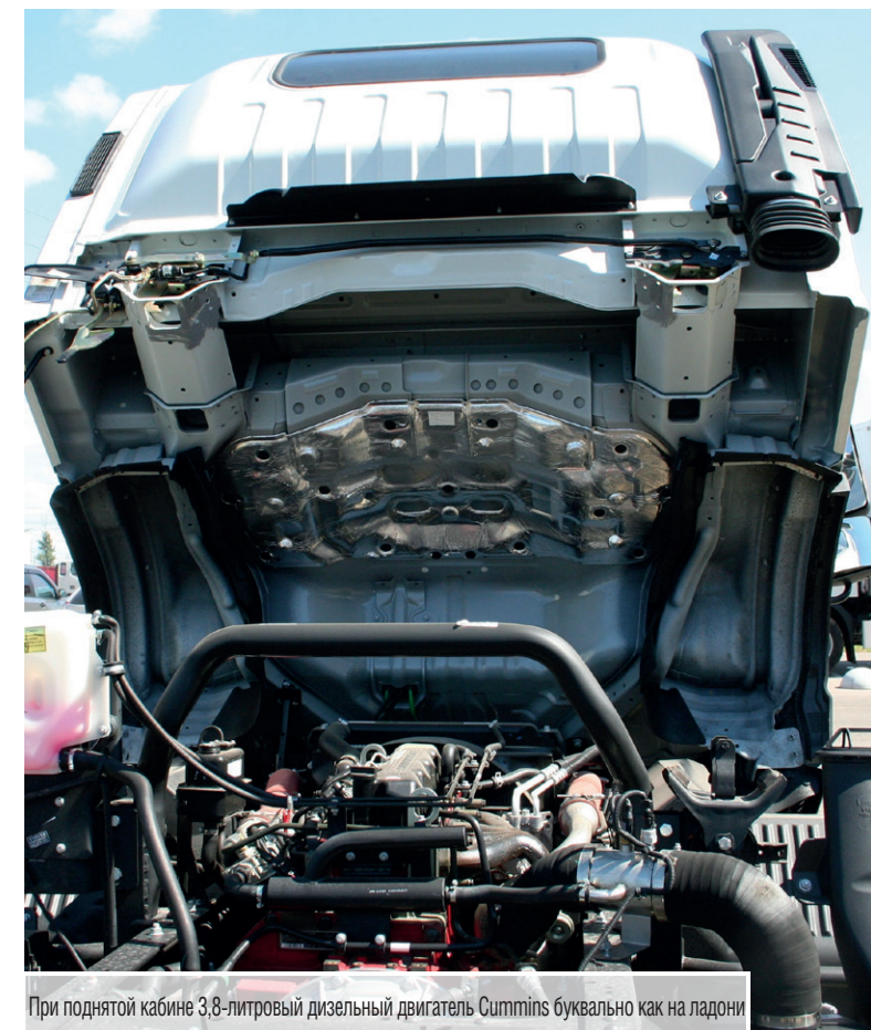
При поднятой кабине 3,8-литровый дизельный двигатель Cummins буквально как на ладони