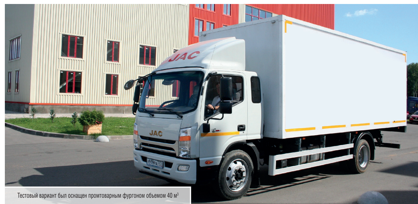
Тестовый вариант был оснащен промтоварным фургоном объемом 40 м³